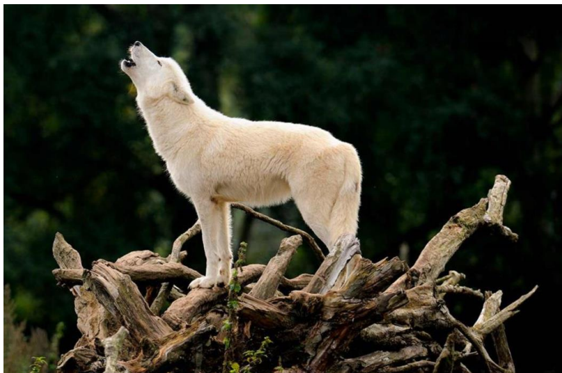
Ulv med hvid pels. https://reepark.dk/for-skoler/dyr/nordamerika/arktisk-ulf

En noaide (shaman) kunne komme i trance ved at tromme og synge på en bestemt måde (joik).