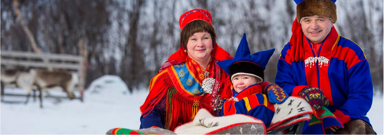
En moderne familie i nationaldragt.

https://www.visitnorway.dk/typisk-norge/8-fascinerede-fakta-om-samerne/