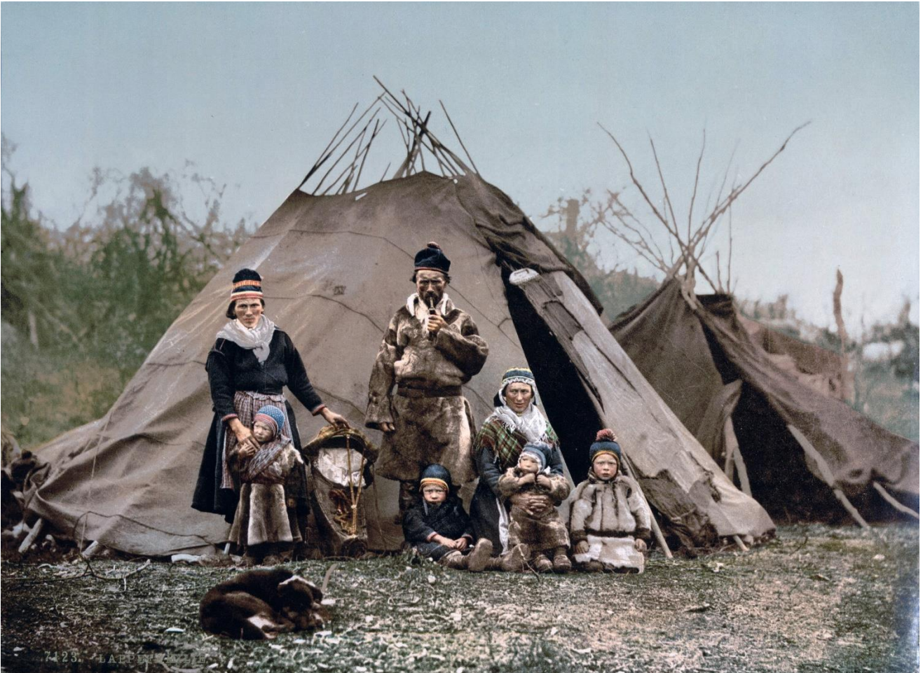
En familie fra ca. 1896. Teltens tynde træstammer er beklædt med skind. Teltet kaldes en lavvu. I slutningen af 1800-tallet kunne man ikke tage farvefotos, så billedet er farvelagt i moderne tid.

https://www.visitnorway.dk/typisk-norge/8-fascinerede-fakta-om-samerne/