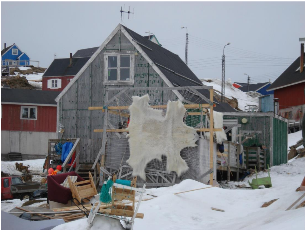
Isbjørneskind i Upernavik.

En isbjørn vejer 150 – 500 kg. De allerstørste kan blive op til 1000 kg (1 ton).