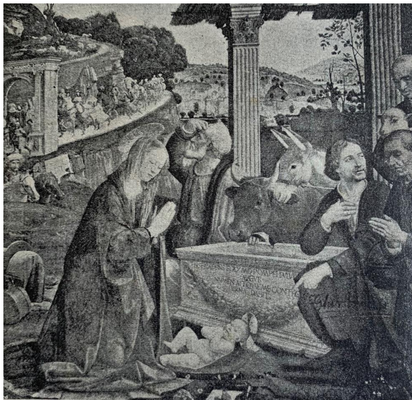
Jesu Fødsel. Fra Børnevennen 1907