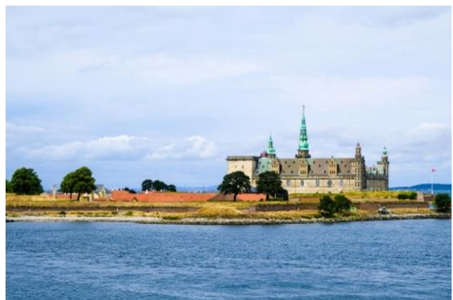
Royaltyfri stockfoto-ID: 1381741697 med standard-licens