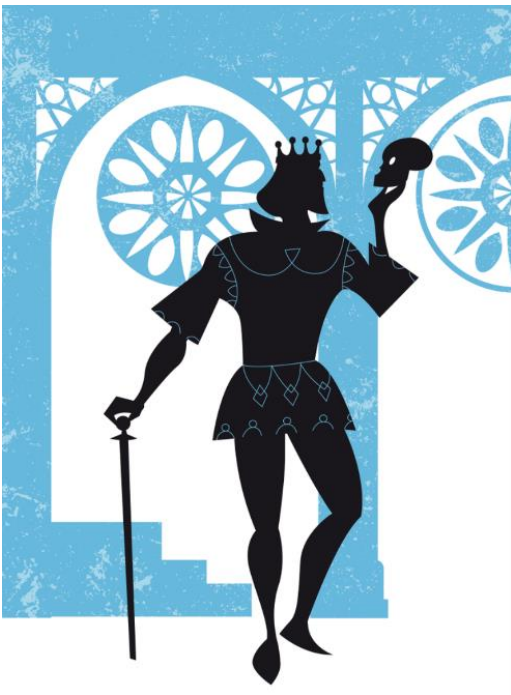
Royaltyfri stockvektor-ID: 1066237244 med standard-licens

På det andet billede kan du se Kronborg Slot.