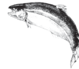
Lax från Skottland