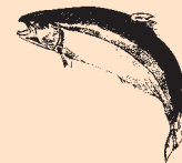
Scottish Atlantic Salmon