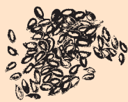
British Grown Linseed