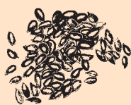
British Grown Linseed