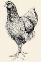
Ross & Cobb kyckling