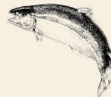
Lax från Skottland