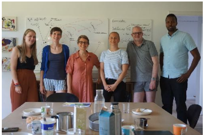
Sekretariatet - som vi så ud i august: varme, shorts og glæde ved udsigterne til alt det vi skulle lave sammen...