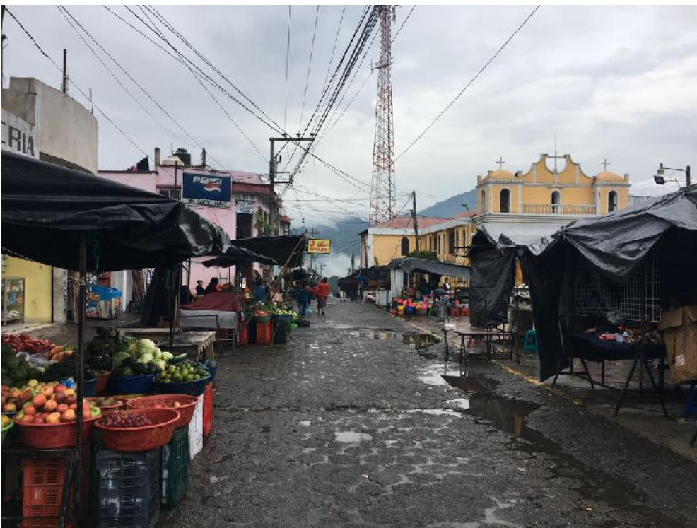
Markedet i Acatenango kl. 15:00. Det regnede hver dag kl 15:00...

Permakultur ligner på mange måder det, forskerne nåede frem til i 80erne, og som de kaldte 'positiv fred' modsat, fraværet af vold, som de kaldte 'negativ fred'.