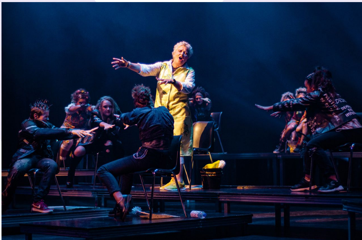
Zaanse Zeikers aangepast naar anderhalve meter-voorstelling

Vanwege corona zijn heel veel voorstellingen, projecten en presentaties niet doorgegaan. Samen met de netwerkdocenten hebben wij in 2020 steeds gekeken wat er nog wél kon, soms in een zeer aangepaste versie. Een mooi voorbeeld daarvan is het interdisciplinaire project Zeebende . Dat liet de kracht zien van een samenwerkingsproject binnen het programma Vrije Tijd. Een voorbeeld hoe je als netwerkorganisatie, waar je met zelfstandige netwerkdocenten door samen te leren en onder coaching mooie projecten neer kunt zetten.