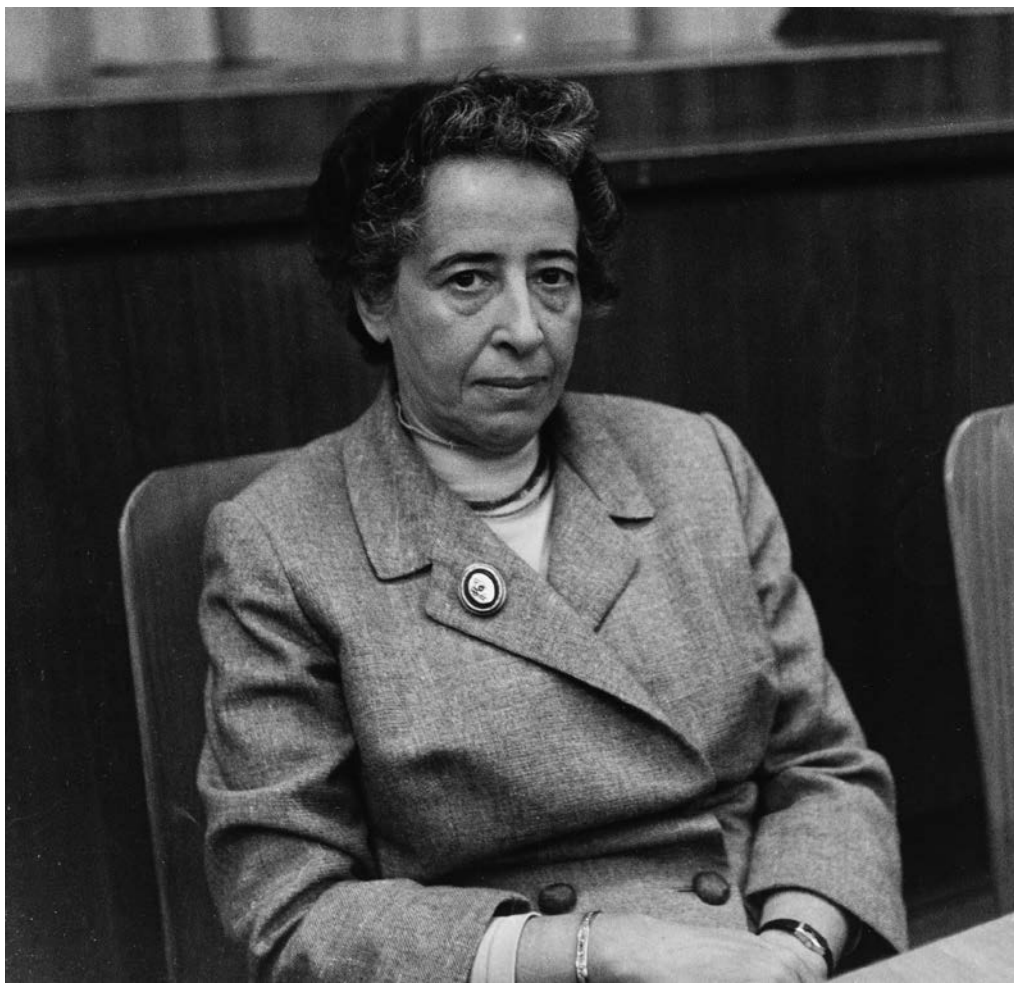
Hannah Arendt vuonna 1958.

Heidelbergin teologinen tiedekunta ei ollut katolinen. Katolisille teologeille Raa- matun ymmärtäminen oli siinä mielessä