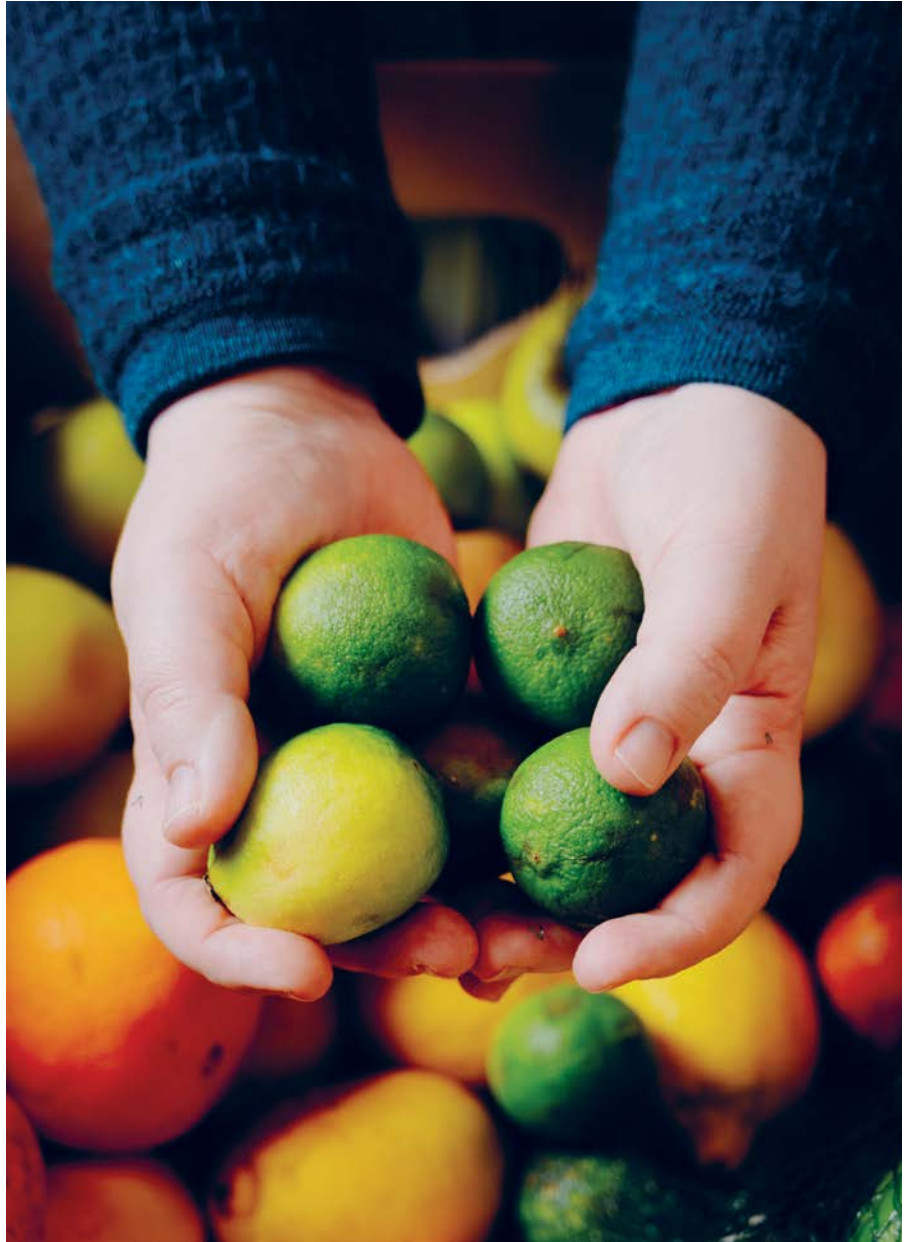
Caritaksen ruokajaossa on viikoittain vaihteleva määrä kaupoista Stadin safran noutamaa ja eteenpäin jaettava hävikkiruokaa. Laatikoista saattaa löytyä hedelmiä, leipää, kasviksia – joskus jopa lihaa.

sen työssä keskeistä ympäri maailmaa – usein se on toiminnoissa etusijalla. Caritas Europa julkaisi vuonna 2025 selvityksen, jossa vertailtiin eri Euroopan maiden mini-