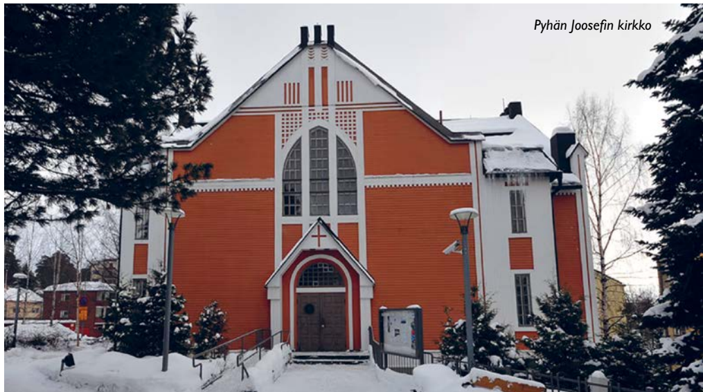
Pyhän Joosefin kirkko

Kiinteistöstrategia sisältää kattavan nykytila-analyysin hiippakunnan kiinteistöportfoliosta, joka käsittää kirkkoja, kappeleita, pappiloita, asuinkiinteistöjä, päiväkotitiloja sekä luostaritiloja ympäri Suomen. Kiinteistöjä tarkasteltiin strategiatyössä esimerkiksi teknisen kunnan, toiminnallisuuden ja käyttötarpeen näkökulmista. Hiippakunnan kiinteistökannan suuntaa antava korjausvelka on noin 9,7 miljoonaa euroa. Kiinteistökannan kunnan säilyttäminen nykytasolla edellyttää laskennallisesti (teoreettisesti) yli 800 000 euron vuosittaista investointia erilaisiin peruskorjaus- ja rakennushankkeisiin. Korjausvelkaa on tavoitteena vähentää korjaushanke ja investointi kerrallaan. Sen tahtaminen ei tapahdu hetkessä, vaan vaatii pitkäjänteistä työtä.