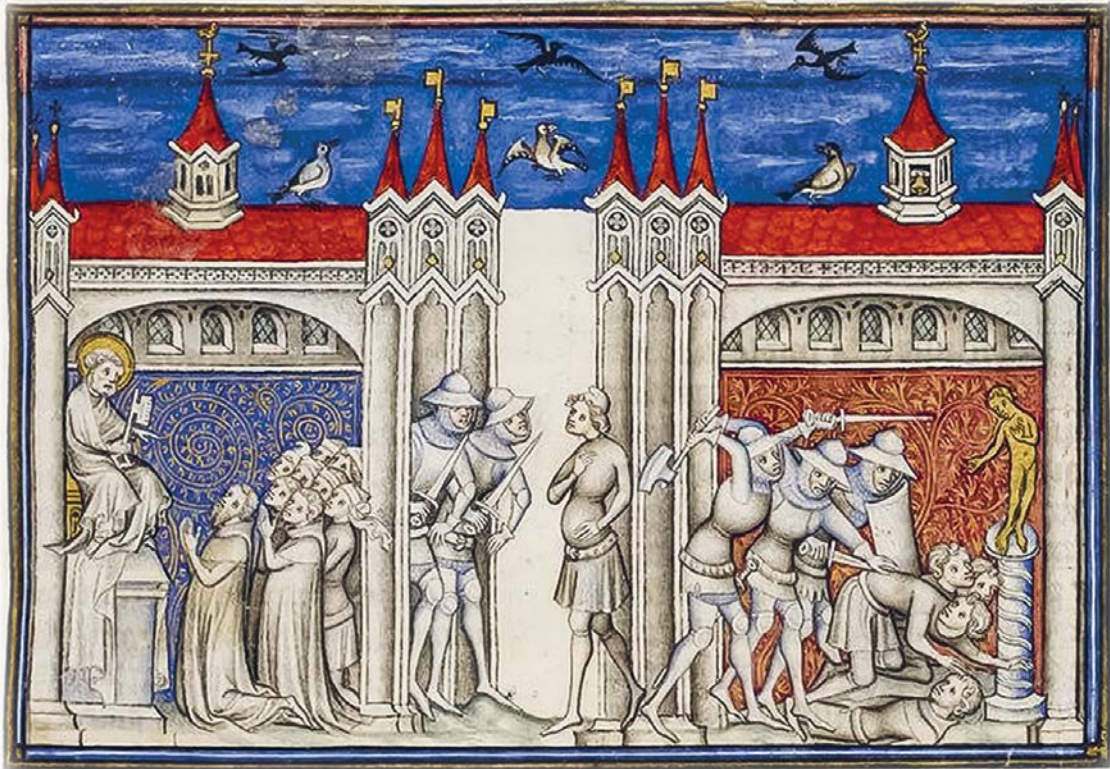
Pyhän Augustinuksen Jumalan valtio -teoksen kuvitusta Raoul de Preslesin käännöksessä vuodelta 1375. gallica.bnf.fr

mahdolliseksi sen, mitä nykyään kutsumme ekumeniaksi.