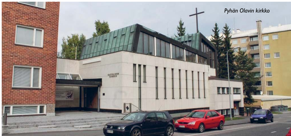
Pyhän Olavin kirkko

Kiinteistöstrategian käytännön toteuttamisen tueksi hiippakunta otti syksyllä 2025 käyttöön CREM -kiinteistöjohtamisen ohjelmiston. Ohjelmisto mahdollistaa kiinteistötietojen keskitetyn hallinnan, huoltotietojen ylläpidon sekä korjausvelan systemaattisen seurannan. CREM-järjestelmä tukee ja selkeyttää konkreettisesti kiinteistötietojen käsittelyä ja auttaa varmistamaan, että kiinteistöihin liittyvät pää-