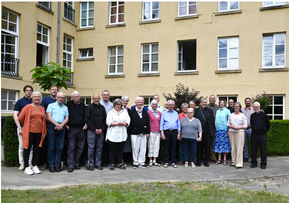
Opintopäivien osallistajat Haus Ohrbeckin pihalla.