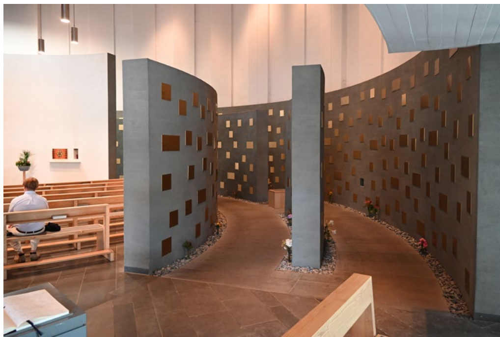
Pyhän perheen kirkon kolumbaario.

suoranainen ilmastopaniikki, ehkä vain yleisempi maallistuminen ja yliluonnollisten asioiden etäälle työntäminen. Joka tapauksessa paljon jää puuttumaan kaikesta, jos katse käännetään vain taaksepäin, siihen, mitä vainaja maan päällä sai aikaan, eikä anneta mahdollisuutta kristilliselle toivolle siitä, että kuolemaa seuraa ylösnousemus ja mahdollisuus kaikkien rakkaiden ja Rakkauden itsensä kohtaamiseen kasvoista kasvoihin iankaikkisesti.