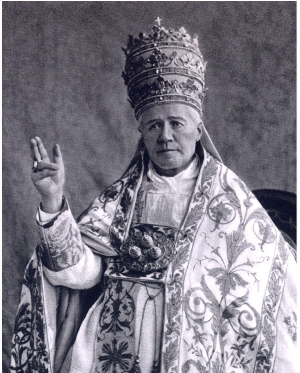
Pyhä Pius X

Ja todellakin, ketä eivät ne monet psalmien kohdat liikuttaisi, joissa julistetaan niin syvästi Jumalan suunnatonta valtasuuruutta, hänen