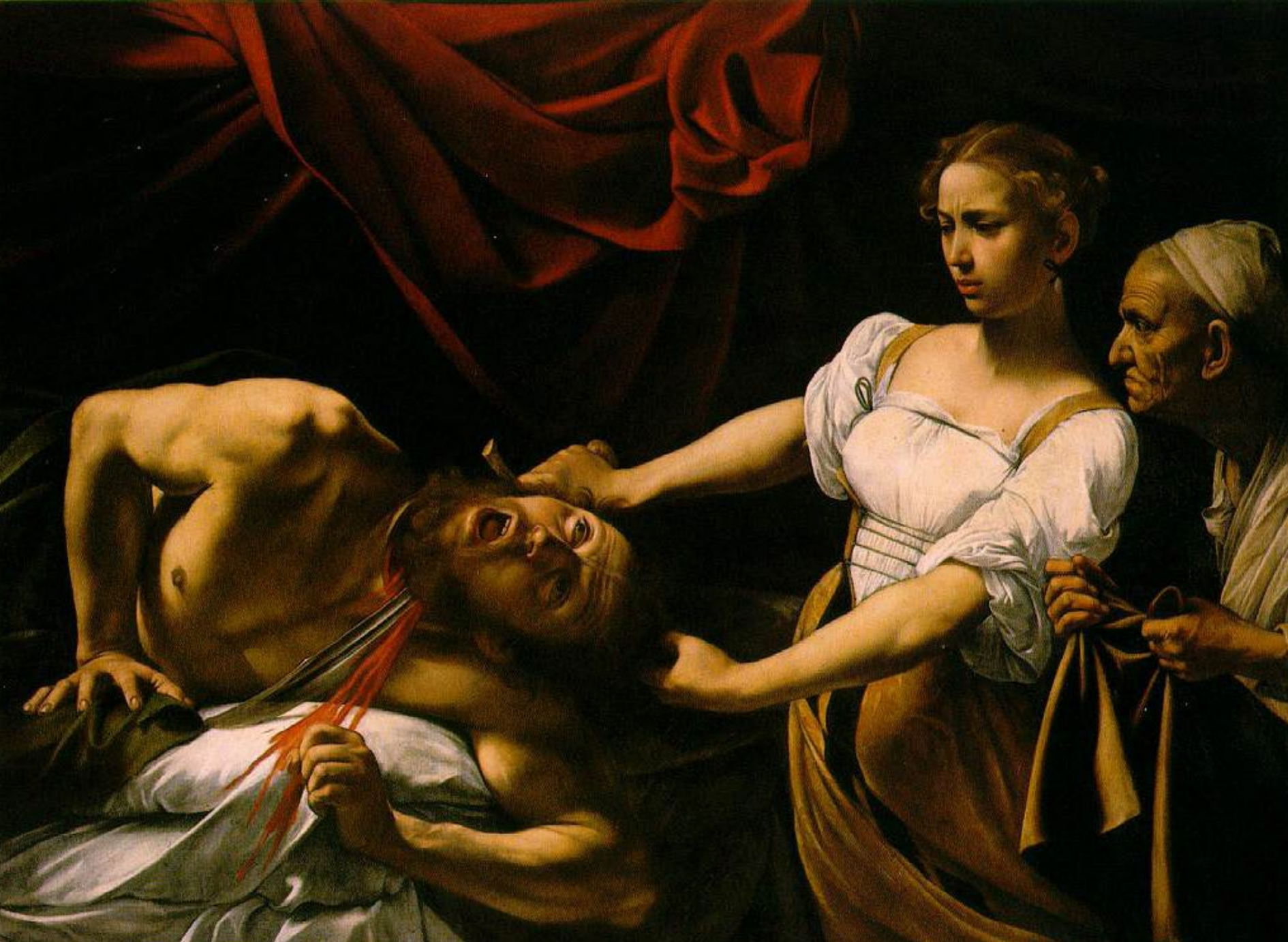
Judit leikkaa Holoferneen pään irti. Caravaggion maalaus noin vuodelta 1598.

meidän varassamme. Herra, meidän Jumalamme, koettelee meitä samalla tavalla kuin kantaisiamme; kiittäkäämme häntä kaikesta tästä. ... Kun Herra kurittaa niitä, jotka häneen turvaavat, hän ohjaa heitä oikeaan." (Jdt.8:25, 27d). Kaupungin vanhimmat kiittivät Juditin viisautta ja vilpittömyyttä pyytäneen hurskasta naista rukoilemaan Jumalalta sadetta, joka sammuttaa janon. Mutta Juditilla oli mielessään rukouksen lisäksi teko, josta kansa tulisi kertomaan sukupolvekseen toiseen.