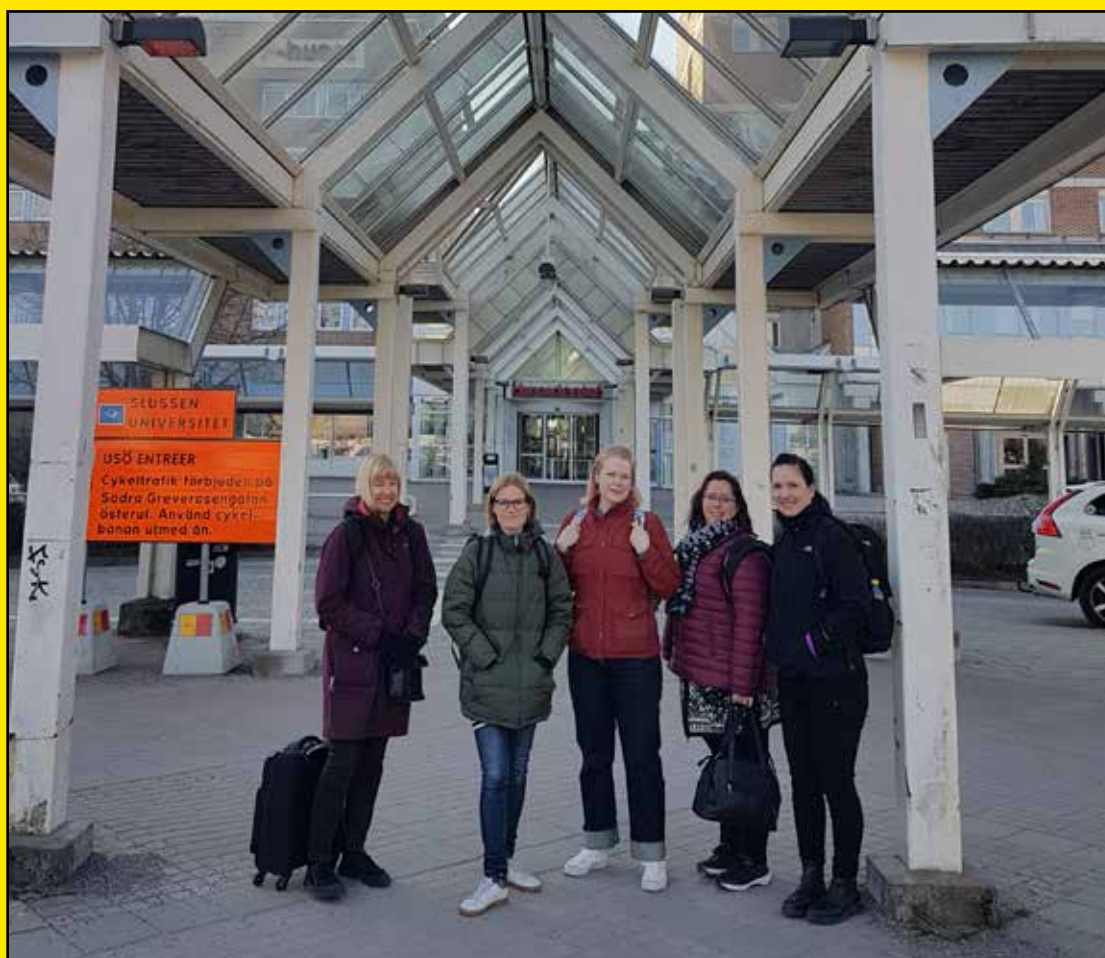
Några av deltagarna i kursen Synutveckling och barns syn, sid 17

Tidskrift för fakta, debatt och utveckling kring synskaderehabilitering