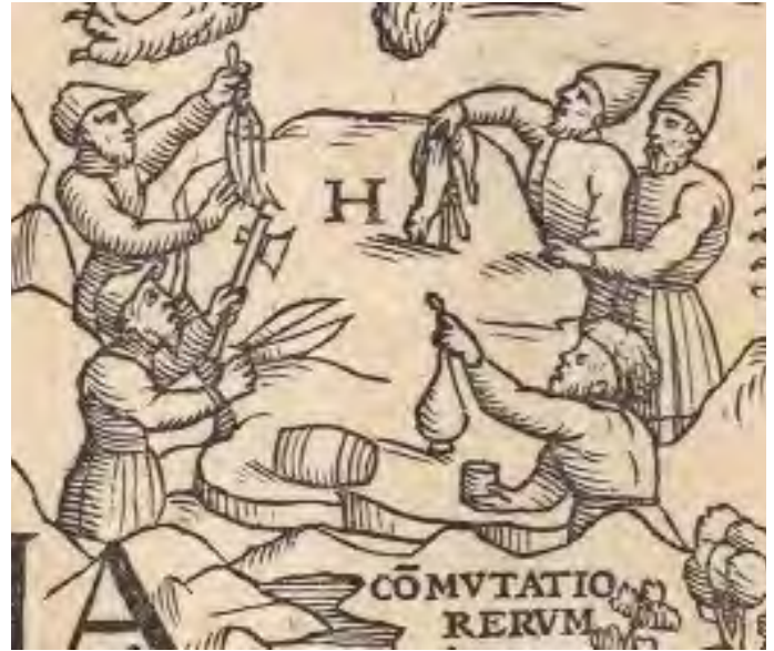
Kaupankäyntiä Pellon lähellä. Yksityiskohta Carta Marinasta (1539).

Pirkkalaisten merkityksestä kertoo se, että heidät mainitaan jopa kaukaisissa islamilaisissa lähteissä. Maantieteilijä al-Idrisi kuvasi 1100-luvulla teoksessaan Tabula Rogeriana pohjoista "Fymarkin" maata, jonka kuninkaalla oli omistuksia Jäämerellä. Tämä on painava historiallinen todiste kveeni- ja suomalaistaustaisista kauppiaista, joiden verkostot ulottuivat Ykeänvuonolle asti.