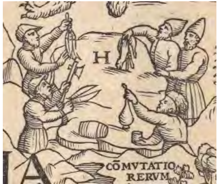
Handel nära Pello. Detalj ur Carta Marina (1539).

Deras betydelse framgår också av att de nämns i avlägsna islamiska källor. Geografen al-Idrisi beskrev på 1100-talet i Tabula Rogeriana det nordliga landet ”Fymark”, vars kung hade ägor vid Ishavet – ett tungt historiskt indicium på kven- och finskättade handelsmän med nätverk ända till Ykeänvuono.