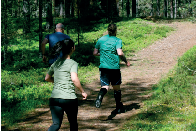
Terränglöpning Jaktstart Karlsborg