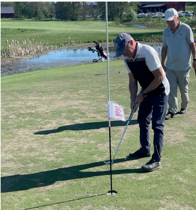
Golf Haninge Strand/Husby