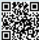
Una tooruk imaluunniit QR-kode scanneruk

Assersuutip takutippaa, meeqqat innarlersimasumik pissusilersortut eqqissisimasumik aalajagersimasumik sinaakkuteqartinnissat kiisalu inersimasumut ataasinnaarmut atassuteqarnissaanut periarfissaqarnissaata pingaaruteqassusaa. Meeraaqqap inersimasumut timikkut attaveqarfeqarnissaq pisiaqartippaa.