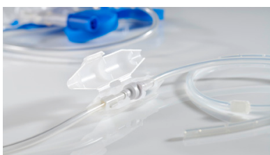
drainova® clickFix No.art. P1100 | 1 UV = 10 pezzi