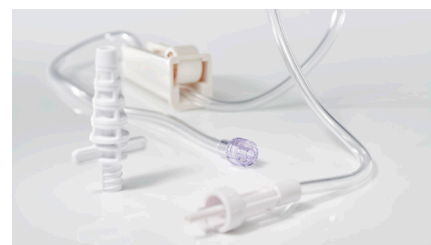
PleurX™ tubo flessibile di collegamento No.art. 50-7245 | 1 UV = 10 pezzi