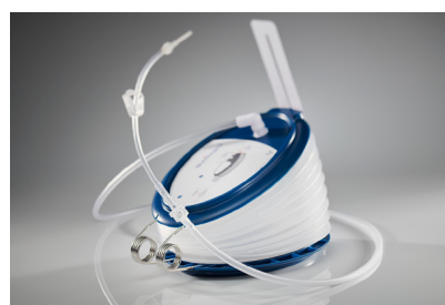
Serbatoio drainova® No.art.2010 | 1 UV = 10 pezzi