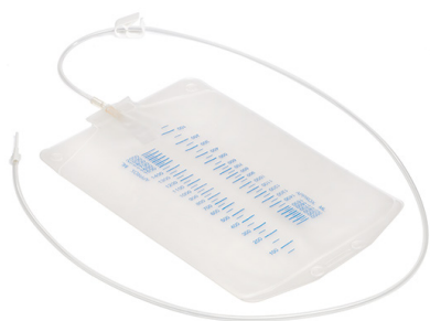
ewimed sacchetto a caduta, capacità 2000 ml No.art. 50-7220 | 1 UV = 10 pezzi