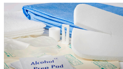
Kit di materiale per medicazione drainova® No.art. 8020 | 1 UV = 10 kits