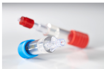
drainova® adattore 3/8 LLW No.art. P8448 | 1 UV = 10 pezzi