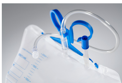
ewimed Pneu-Pack II No.art. P7899 | 1 UV = 10 pezzi