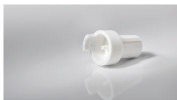
PleurX™ cappuccio protettivo No.art. 50-7235 | 1 UV = 10 pezzi