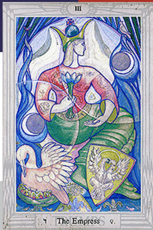
6 The Empress 9.