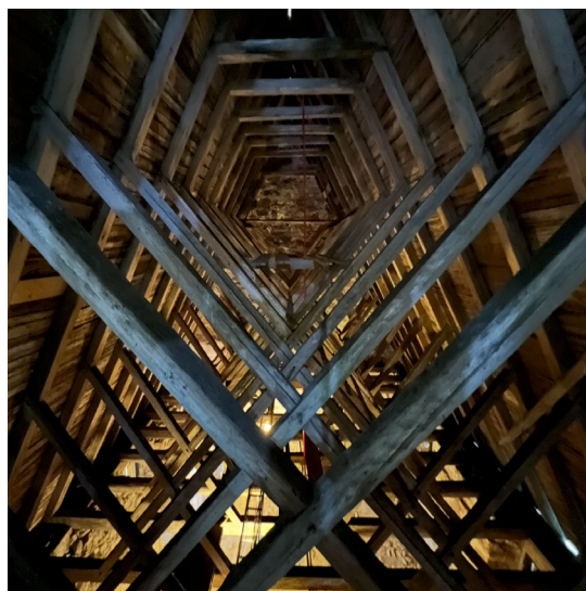
Leksands kyrkvind, Foto Elias Bernsveden Hossmo taklag, Växjö stift, Foto Kalle Melin