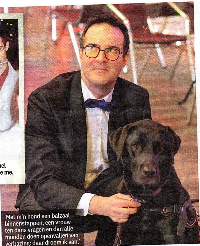
'Met m'n hond een balzaal binnenstappen, een vrouw ten dans vragen en dan alle monden doen opvallen van verbazing: daar droom ik van.'