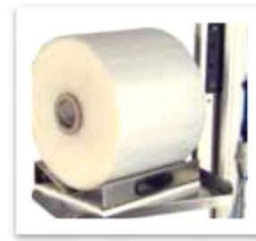
Flak med V-block