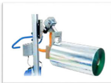
Expand & Turn- Pneumatisk expander med elektrisk vrid