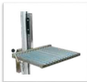
Rullflak med sidomatning