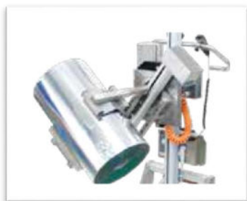
Squeeze & Turn- kläm och vrid