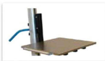
Flak med kantrulle

Vi har ett stort antal standardverktyg som lastplan, gafflar kontroll-räknevåg samt squeeze & Turn och vår pneumatiska expander Expand & turn. Vi tillverkar utöver detta även många kundspecifika verktyg.