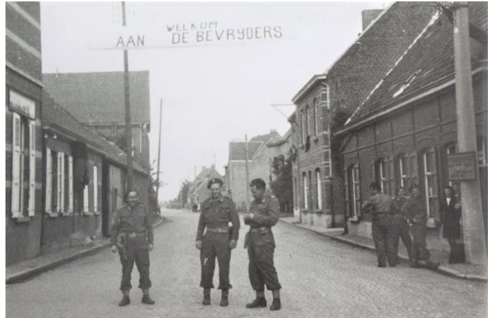
Spandoek boven het kruispunt Aalterstraat (Stwg. op Deinze) en de Dorpstraat (Lodorp): “Welkom aan de bevrijders”. Drie Poolse officieren lieten zich fotograferen onder het laken terwijl enkele militairen en burgers toekeken.