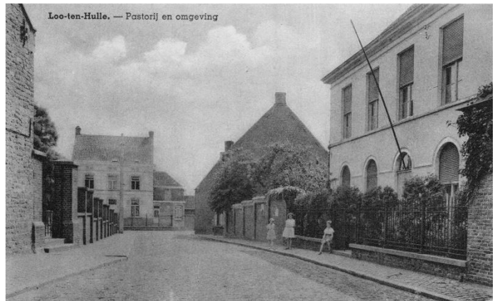
De kerk met de pastorie en omgeving zoals deze er eind september 1944 uitzag, alles ligt er netjes bij.