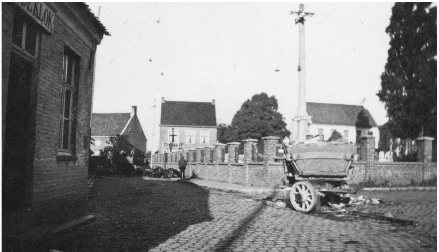
10 september 1944: zicht op het dorp na de aftocht van de Duitsers. Een achtergelaten kar op de hoek van de kerkhofmuur en verderop ligt de weg bezaaid met dode paarden.

Daarna kon men beginnen met het opruimen van alles wat door de Duitsers, op hun terugtocht, werd achtergelaten. De dorpskern, vooral rond het kerkplein en de Poekestraat, bezaaid met dode paarden, achtergelaten fietsen en ander oorlogsmateriaal moest zo vlug mogelijk vrijgemaakt worden.