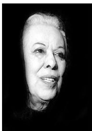
بیاد سیمین دانشور