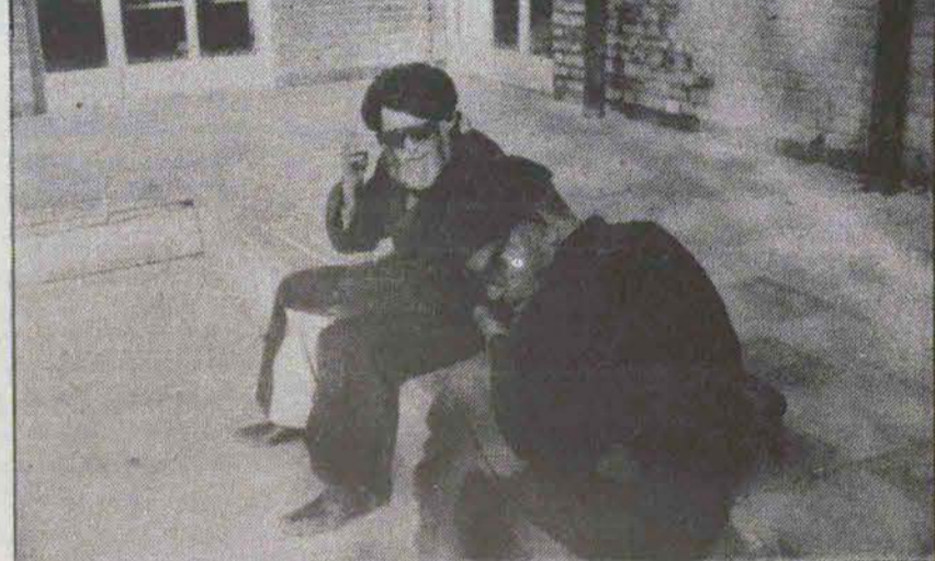
سالیان سال است که اینچنین خاموش نشستن را تجربه کردهاند ولی امروز...