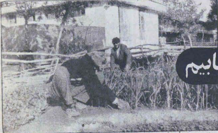
این مردان پاکدل تلاش میکنند تا با رویانیدن گیاه، دربع طبیعت را نسبت به خود، منصفانه پاسخ گویند.