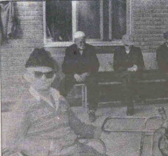
در جمعندولی تنها! هر کدام در فکر فردای خویش، فردائی که بهرحال میتواند روز دیگری باشد.