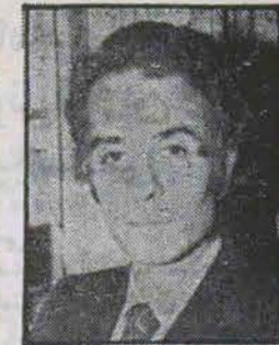
مصاحبه با دکتر سامی