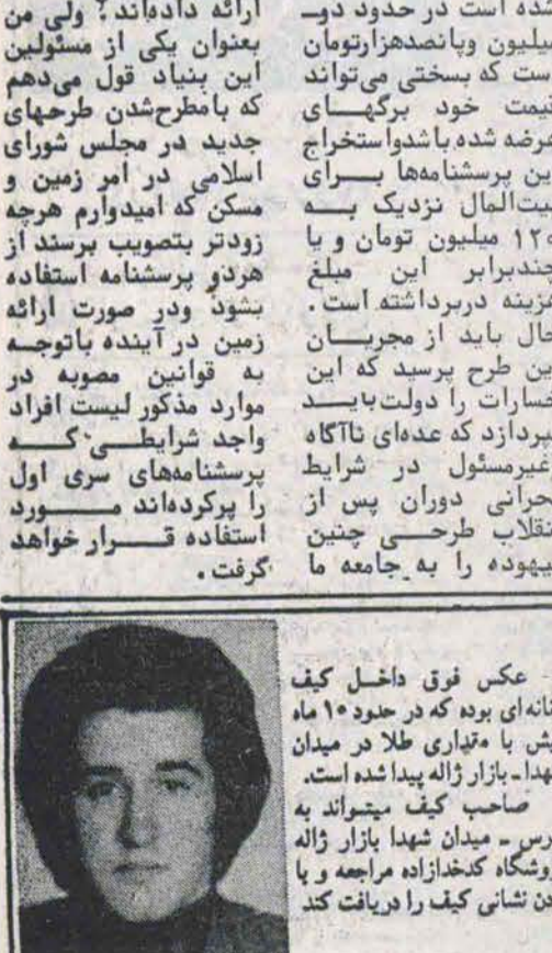
عکس فوق داخلی کف زنانه‌ای بوده که در حدود ۱۰ ماه پیش با متاری طار در میدان شهدا بازار زاله شده است. صاحب کف مجزانه به آدرس میدان شهدا بازار زاله فروخته‌ا که گزاره‌ها مراجعه و با دانه شانی کف را دریافت کند.

توضیح انقلاب اسلامی در خصوص وقایع اخیر و موضع‌گیری‌های دولت. این توضیح شامل تحلیل شرایط فعلی و راهکارهاست.