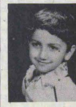
خانواده عسگری گهر

دگرگشت بزرگ مرد مبارز سرکار سرنگ زاهدی را به خانواده های سعیدیان، علائی و پزشک تسلیت عرض و خود را در سوگ این عزیز از دست رفته شریک می‌دانیم.