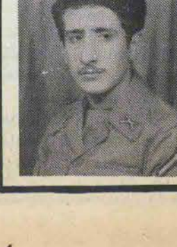
خانواده های امیری

بیباید و هرجا که می‌خواهند به سلامت بروند و به این مناسبت و در این مناسبت تحت تعقیب واقع نمی‌شوند و توقیف هم نمی‌شوند.