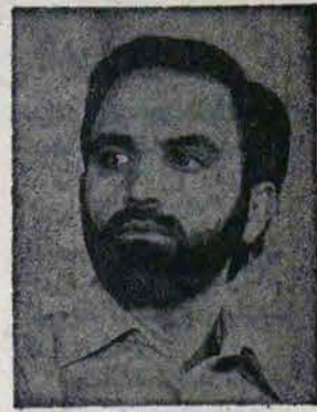
دکتر عبدالکریم سروش