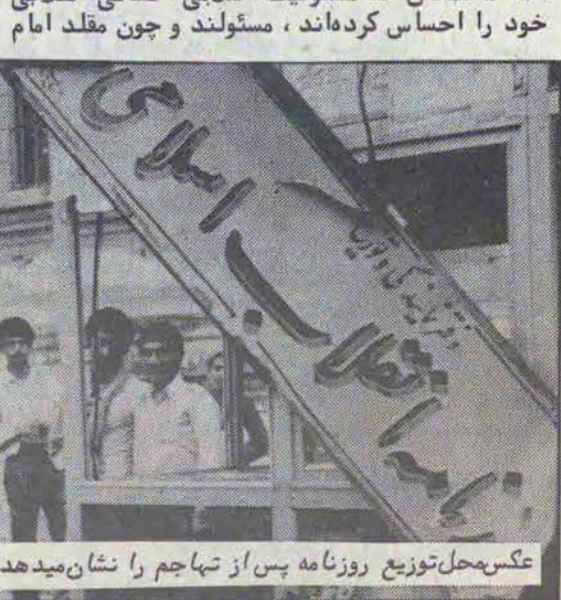
عکس محل توزیع روزنامه پس از تهاجم را نشان میدهد