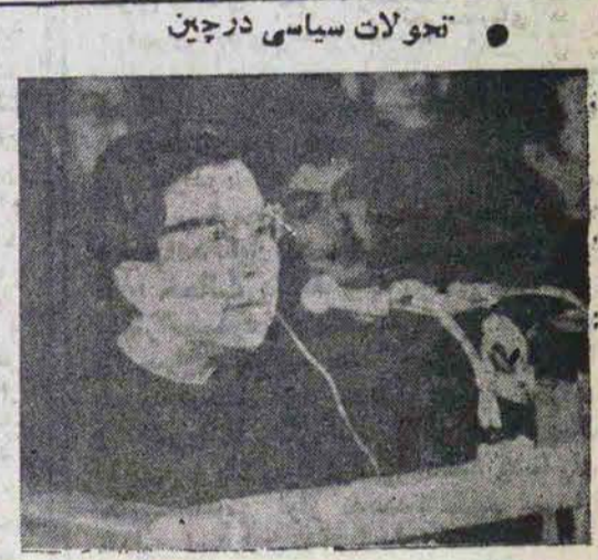
تجولات سیاسی در چین

از جمله حوادثی که طی سال گذشته در چین توجه جهانیان را بخود جلب کرده بود، محاکمه گروه ۴ نفری، برکناری هواکونگ و ارتباط نزدیک این کشور با غرب و بویژه با آمریکا می باشد.