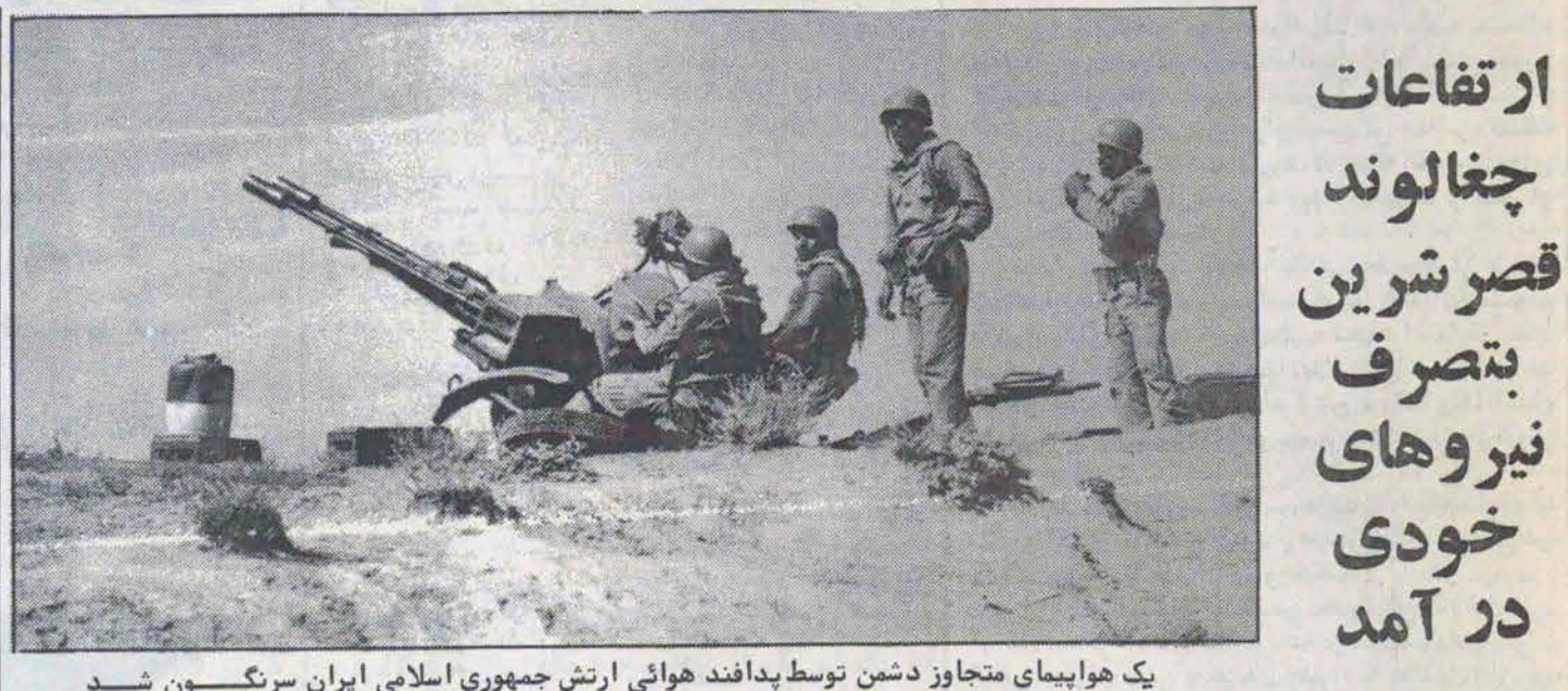
یک هواپیمای متجاوز دشمن توسط پدافند هوایی ارتش جمهوری اسلامی ایران سرنگون شد

پوزش از خوانندگان بعلت اشتباهی که در کار امروز ما پیش آمده است روزنامه در صفحه انتشار می‌یابد و از فردا روزنامه گمان در ۱۴ صفحه انتشار خواهد یافت. با پوزش از همه خوانندگان عزیز. مذاکره وزیر خارجه مصر با سران کشورهای اروپایی در صفحه آخر