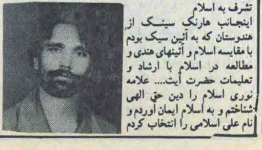
نام علی اسلامی را انتخاب کرد

و ارشاد به تعلیم اسلام دارند چه اثری بوجه میآورند؟ این اعمال در اعضای نهادهای انقلابی که