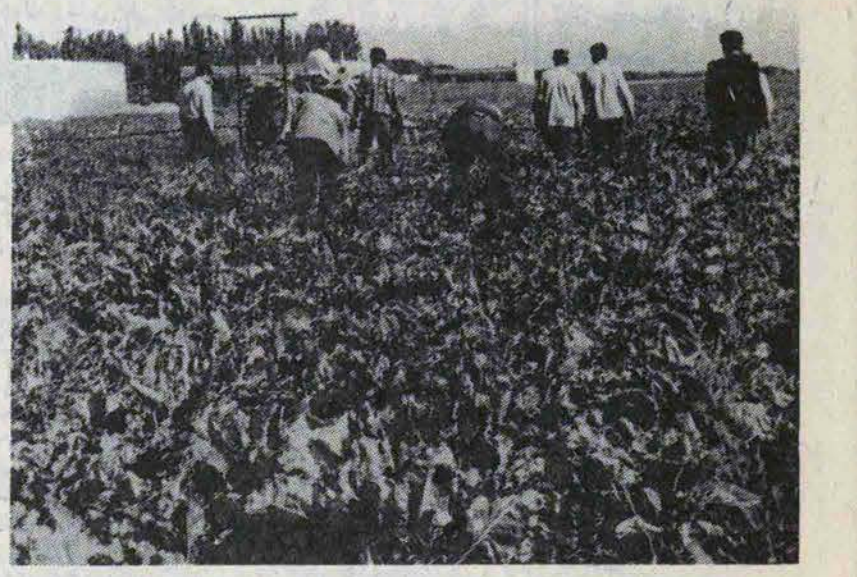
از نظر هیئت واگذاری زمین در صورت عدم اجرای بند «ح» در شرایط حاضر این امر منتج به ضربه فرهنگی بزرگی برای حیثیت دولت اسلامی در روستاهای مورد بحث خواهد شد

علاوه بر موارد فوق در سایر روستاهای استان همدان هر چند هنوز حکم قطعی واگذاری زمین صادر نشده است ولی زمینهای مورد اختلاف (بیشتر