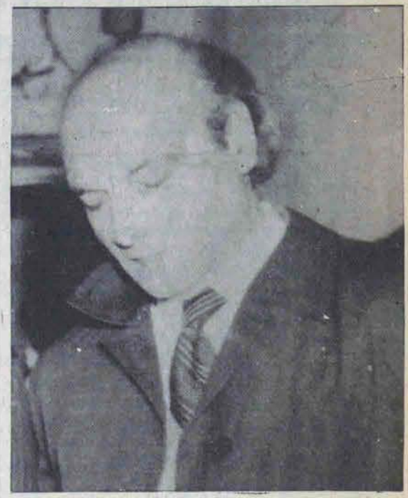
● (قسمت آخر)