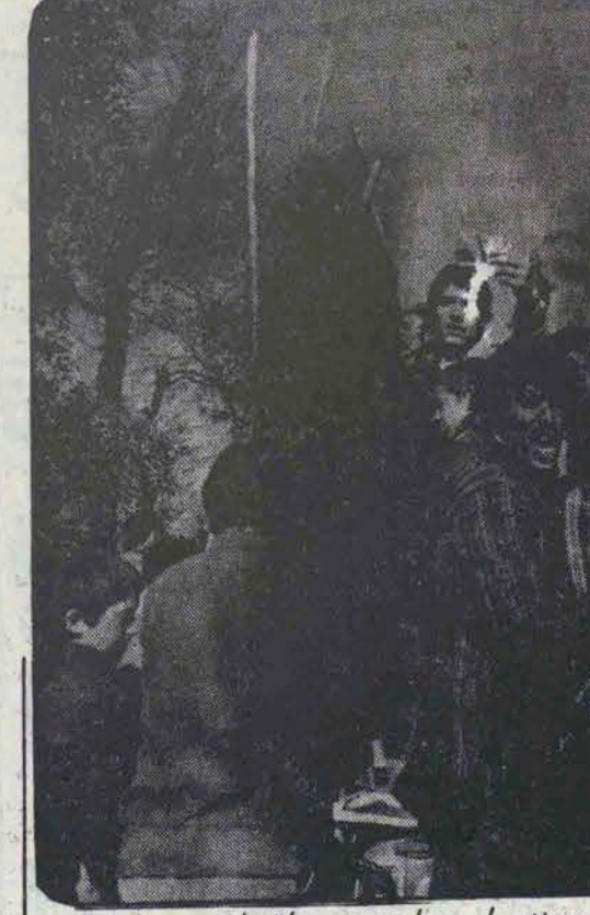
چماقداری و چماقداران همواره بعنوان یکعامل منفی در صحنه سیاسی جامعه حضور داشته‌اند... و اینها چماقداران آریا می‌باشند که دزدان انقلاب را آه‌ها را و احیاء لقتل داشت.

هستند که متأسفانه گاه از جانب ارگانهائی کوطیفه ایجاد نظم را هم بعهده دارند حمایت می‌شوند.