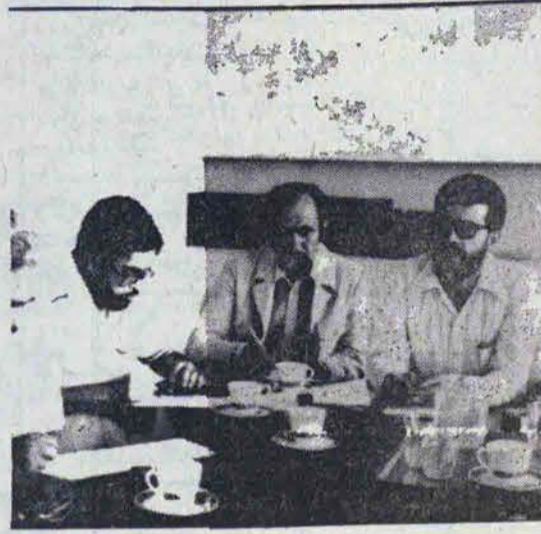
معاونان وزیر کشاورزی در جلسه بررسی وضعیت علوفه دام در کشور.

سوال یکی از خبرنگاران: در مورد وضعیت علوفه دام در کشور اظهار داشت: البته در این مورد آمار دقیقی در دست ندارم و برآوردی در این باره نمی‌توانم بدهم. اما به نظر من وضعیت علوفه دام در کشور در این زمینه نسبت به سه سال قبل تا دو برابر افزایش یافته است. سوال دیگری از خبرنگاران: علوفه دام در کشور چگونه تولید می‌شود؟ پاسخ داد: علوفه دام در کشور از طریق روش‌های مختلفی تولید می‌شود. یکی از روش‌ها استفاده از زمین‌های حاصلخیز و حاصلخیزتر و با استفاده از علوفه حاصل از زمین‌های حاصلخیز و حاصلخیزتر است. سوال دیگری از خبرنگاران: علوفه دام در کشور چگونه توزیع می‌شود؟ پاسخ داد: علوفه دام در کشور از طریق روش‌های مختلفی توزیع می‌شود. یکی از روش‌ها استفاده از زمین‌های حاصلخیز و حاصلخیزتر و با استفاده از علوفه حاصل از زمین‌های حاصلخیز و حاصلخیزتر است.