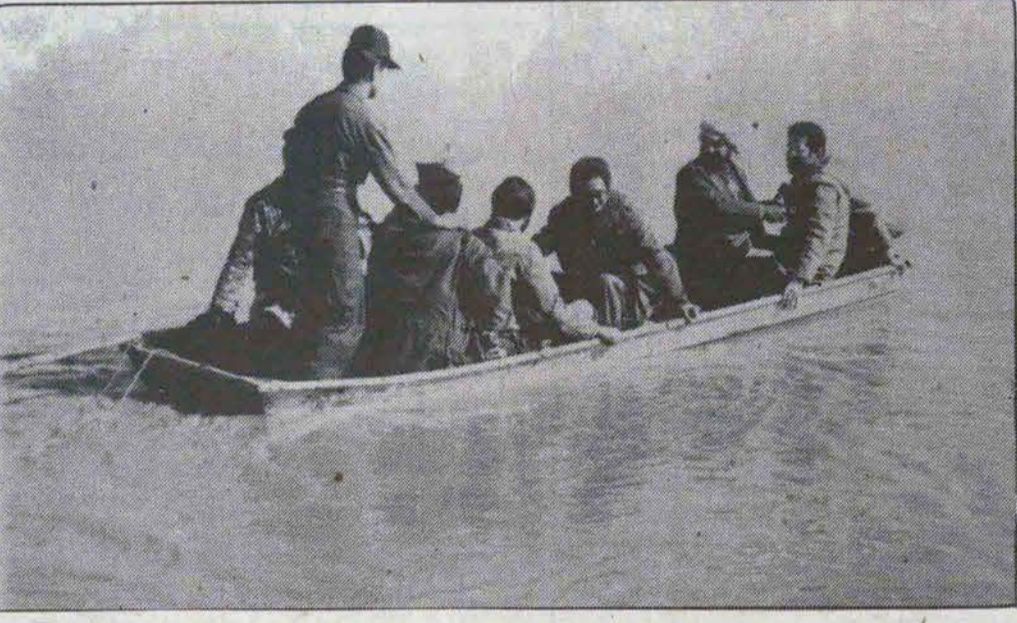
رئیس جمهور و فرمانده کل قوا در حال بازدید از یکی از جبهه های جنوب

اعلام حکومت نظامی در بغداد بمنظور خشی نمودن فعا لیت های جریکی