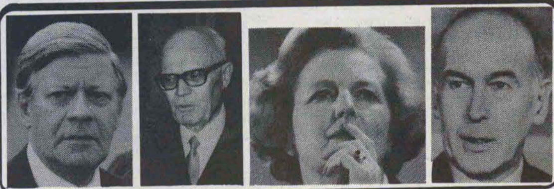
والری زیستگار دست‌نرخست وزیر انگلیس سرتیبری رئیس جمهور ایتالیا هلموت شامت صدراعظم آلمان غربی