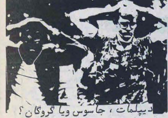
ادبیات، جاسوس ویا گروگان؟