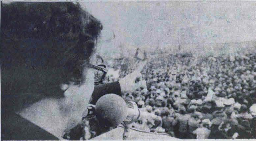
چهارشنبه ۲۸ آبان سخنرانی مهم رئیس‌جمهوری در روز عاشورا در میدان آزادی

یکشنبه ۲۸ آبان سخنرانی مهم رئیس‌جمهوری در روز عاشورا در میدان آزادی