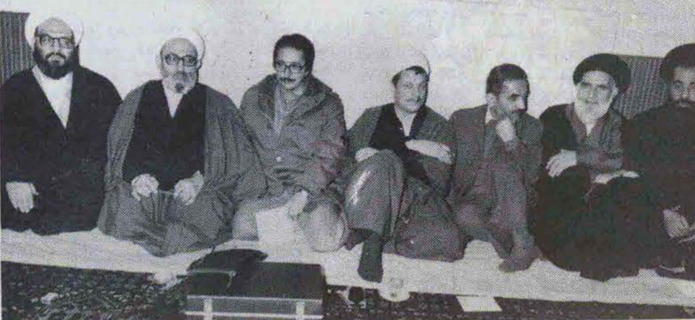
یکشنبه ۱۶ آذرماه ۱۳۵۹ به دعوت روحانیت مبارز هیئت رسیدگی به اختلافات تشکیل شد.

یکشنبه ۲۷ آذرماه ۱۳۵۹ لغو راهپیمایی روز وحدت روحانی‌دانان طرف امام.