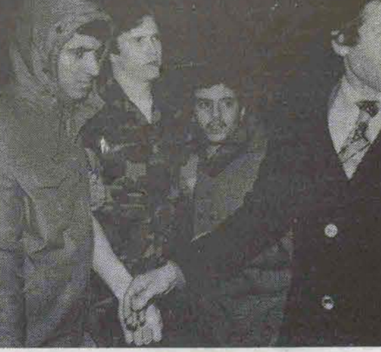
وبالاخره سه‌شنبه شب گذشته ۵۲ گروگان آمریکایی آزاد شدند...

تسخیر سفارت آمریکا یا تعطیل لانه جاسوسی؟! ... این تعهد چنین بیان شده است که "سیاست آمریکا مداخله‌جویی نیست و ایالات متحده در امور داخلی ایران مداخله نمیکند..."