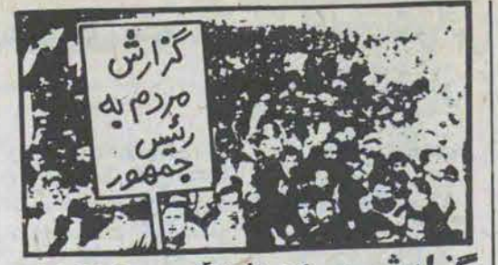
گزارش مردم به رئیس جمهور

دفترباست جمهوری: اینجانب متجدد اصلاهی اهل میانه بدینوسیله به اطلاع میرساند که روز ۵۹/۶/۱۹ بمناسبت سالگرد شهادت پدرالطالقانی نماینده ایالتی در پستهای پدربالطالقانی در خیمیان خیمینی شهران برگزار کرده بودیم که با استقبال پرشور مردم روبرو بود حدود یکساعت از برگزاری نمایشگاه نگذشته بود که ۳ پاسدار یادرست داشتن جکی ازطرف حاکم شرع با مضمون "فروش کتابهای وحشی" و "فروش کتابهای وحشی" جمع آوری کتابها و نمایشگاه را ضالده نمود بعد از جمع کردن کتابها و پوسترها با هم به دادسرا رفتیم که در دادسرا حاکم شرع پس از بازجویی اینجانب را به اتهام عوامفریبی و فروش کتابهای قاجاق و سد معبرکردن در خیابان به یک ماه زندان (۵۰۰۰) پنج هزار ریال جریمه نقدی و ۶۰۰ ضربه شلاق محکوم کرد که بعد از اتمام زندان، ۶۰ ضربه شلاق به اینجانب زده شد که هم اکنون بعد از گذشت حدود ۳ ماه آثاری از آن بر بدنم نمایان است ضمناً "عکس درمورد آزار شکنجه بریدن که حدود ۳ روز بعد از آن گرفته شده است به ضمیمه نامه ارسال میشود لازم به توضیح است که وقتی که در زندان سربسیرم بودم بیبی از برادران گفتم که برای تحویل گرفتن کتابها به دادسرا مراجعه کنید، بعد از مراجعه این برادر به دادسرا حاکم شرع به او گفته بود که تمام کتابهای شما را دادسرا حکم کرده است! ندانم که فتوایی سندمورد اشاره بپیوست نامه ارسال میشود