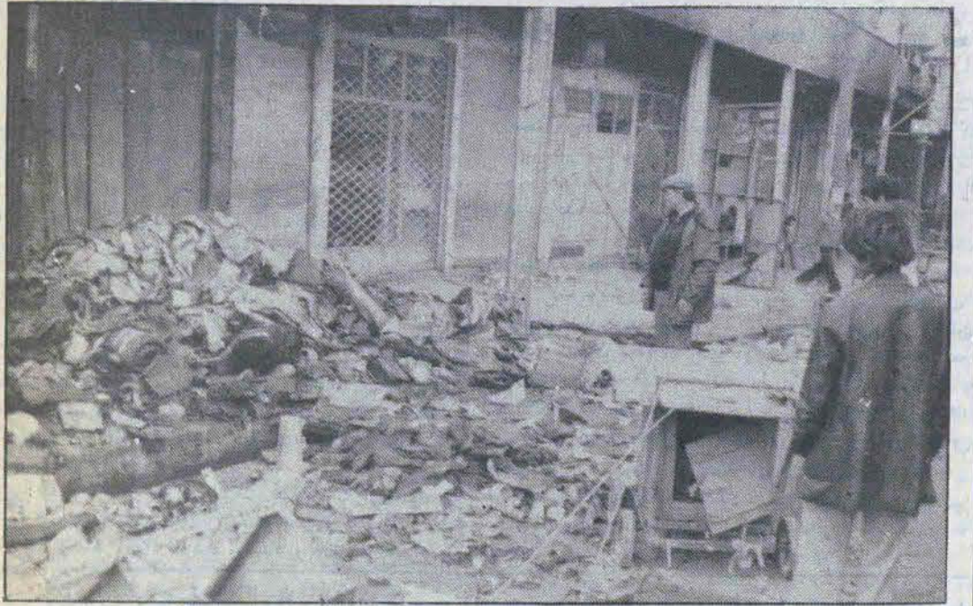
کوشه‌های کوچک از جنایات بزرگ صدام، چه شگفت‌زده برهستی از دست رفته خود مینگرند

بیمارستان پشت جبهه پشتیبانی جنگ است. در مواقع حمله موشکی ما در یک ساعت ۱۰۰ تا ۱۵۰ مجروح داشتیم. در این بیمارستان ما سه مورد هم مجروح عراقی داشتیم که به میل حرفه‌مان هیچ فرقی بین مجروحین خودمان و مجروحین دشمن نگذاشتیم. در مورد تاسین خون و دارو سؤال شد. مدیر داخلی بیمارستان پاسخ داد: