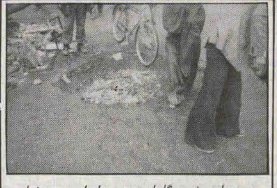
محل برخورد گلوله توپ صدامیان در دزفول

بنام خدا مدتی بود میسندیدم دزفول توسط پوخلانه ارتش عراق روزی چند بار گلوله باران میشود. راهی این شهر شدم تا اقیانان را از نزدیک ببینم. اینبار در بین همسفرانم یک افسر خلبان و یک مکانسین هواپیما بود که توانستم گفتگوئی با آنها داشته باشم. افسر خلبان ستوانیکم حوضی خلبان شکاری بمبافکن فانتوم بود، او میگفت خستوندم از اینکه چنین رهبر و رئیس‌جمهوری دارم و امیدوارم لیاقت آنها را داشته باشم. او در مورد پروازهای جنگی میگفت هیچ زور و فشاری برای پرواز با اعمال نمیشود حتی برای زدن هدف هم هیچ محدودیتی نداریم