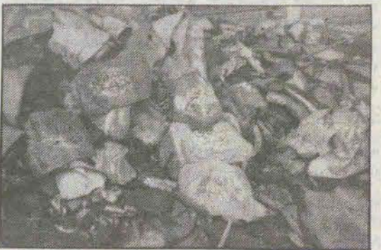
قالبچه‌های کوچک دیوارکوب... پسرک میگفت این معجزه است.

ما عاشق این هستیم که کار مثبتی انجام دهیم و بعد شهید شویم. علت تفرغ خود و همکاری از عراقی‌ها را اینطور بیان داشت: یکی از علت‌های بزرگ تفرغ ما از عراقی‌ها تجاوزات و اعمال خلاف اخلاقی است که این تجاوزات پس از تصرف بعضی از مناطق کلیمان انجام داده‌اند. چون خانواده ما هم در جنگ‌زده‌ها خانواده‌ها هستند و فرقی نمیکند. او در مورد روحیه خلبانان میگفت: ما وقتی خودمان را با همکاران شهیدمان مقایسه میکنیم که دو ماه پیش شهید شدند میگوئیم دو ماه است که اضافه زندگی میکنیم چون این برای ما هم بود و همین حادثه برای ما نیز ممکن بود اتفاق بیفتد.