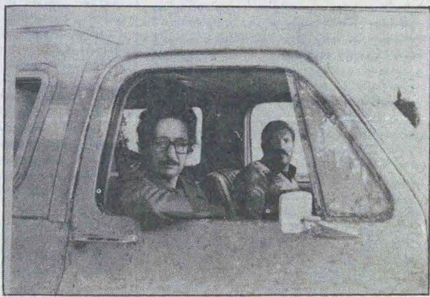
بازگشت رئیس جمهوری به جبهه های جنگ