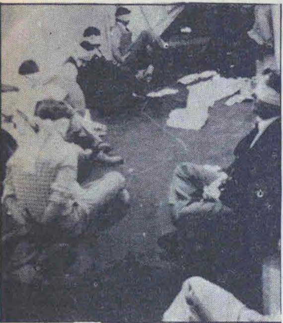
آزادی گروگانها یابانی برگروگانگری؟

اقتصادی بیگانگان هیچ پیشرفتی نداشته‌ایم. و این همه به این علت بوده است که به واقعیتها، دهن کجی کرده‌ایم و از علم و روش مناسب بهره نچسته‌ایم. امید که سال آینده‌مان به زوال پیشین باشد.