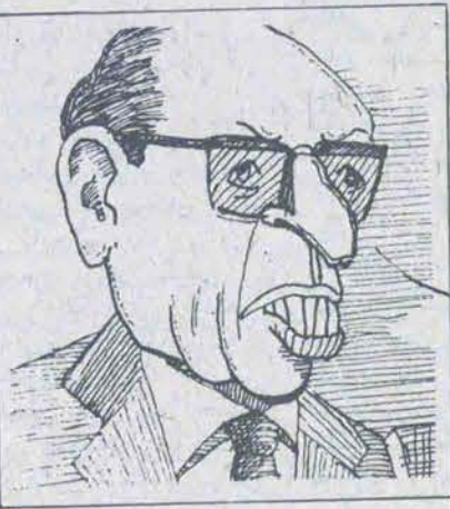
بندنام تأکید بگین مبنی بر افزایش حضور نظامی آمریکا در منطقه، پیشنهاد مشابهی نیز از جانب انورسادات رئیس جمهور مصر بعمل آمد