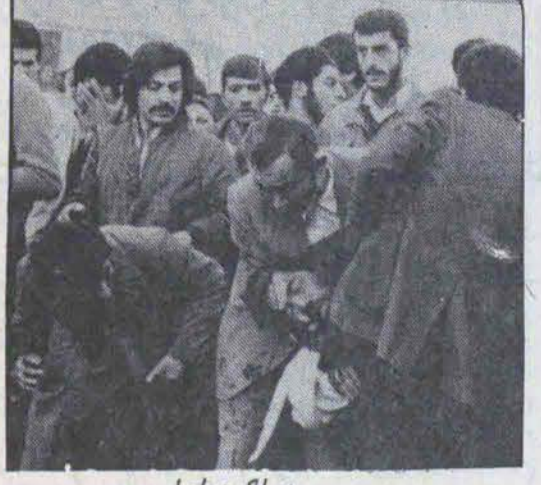
... و به ملکوت اعلی