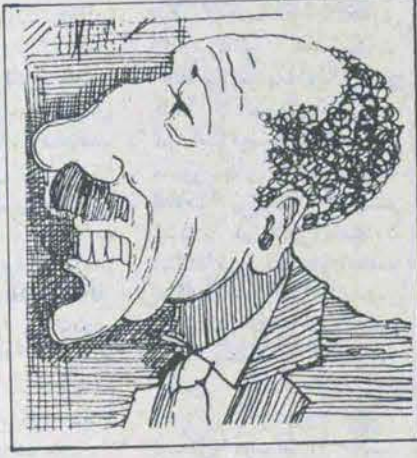
سادات رئیس جمهور مادم العرمصر

بیشتر دولت مناخیم بگین نخست وزیر اسرائیل اشفای قدس توانسته بود با بیش از بیست و یک مخالف به حیات خود ادامه دهد. اما این بار او این ائتلاف را منحل اعلام نمود. بگین با پایان بخشیدن به سفر کوتاه خود از آمریکا به اسرائیل مراجعت و بکرات بسوی کنت شانت جائیکه یک بحث هفت ساعته بیرونی سیاستهای اقتصادی وی صورت گرفته بود. زمانی فضای پارلمان ملو از هیجان شد که کنت با فراغت آراه باردیگر توانست بگین را با اختلاف جزئی سدای، یعنی ۵۷ به ۵۴ درمست قدرت نگاهدارد پس از این رای گیری بگین کوشید تا همانند جرجیل که میگفت دریک دمگراسی بکرای هم کافی است. فیلسوف مآنه رفتار نماید.