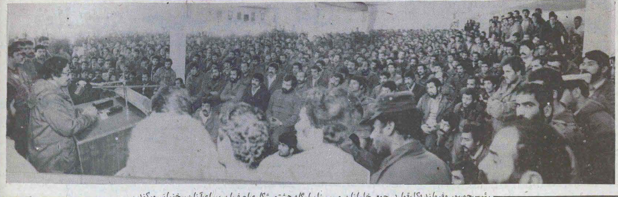
رئیس‌جمهور و فرمانده کل قوا در جمع خلبانان و پرسنل پایگاه هشتم شکاری صفهان، برای آنان سخنرانی میکند.