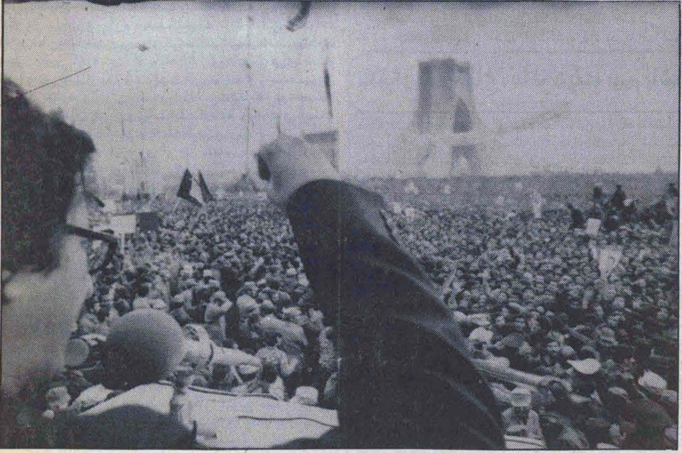
بگذارید دلهای ما نزدیک بهم باشد

بامداد تاسوعای حسینی گروهی بدفتر روزنامه میزان حمله بردند و ضمن اشغال ساختمان خساراتی به اموال و اثاثیه آن وارد ساختند. بگزارش خبرنگار ما اینتعداد که نقاب برچهره داشتند تعدادشان به ۳۰ نفر میرسد و با ابزار از قبیل چکش و... که همراه داشتند پس از تهدید سرایدار ساختمان، اقدام به شکستن درها نموده و وارد دفاتر روزنامه میزان شدند. مهاجمین سپس به تجسس میزها و کمدهای روزنامه پرداخته و ضمن پاره کردن اسناد و مدارک خساراتی به ساختمان وارد ساختند. اشغالگران همچنین شعاری بر در و دیوار دفاتر و ساختمان میزان نوشتند. مهندس هاشم صباغیان نماینده مردم تهران در مجلس شورای اسلامی که از مسئولین روزنامه میزان میباشد، بامداد امروز در تپاسی با خبرنگار ما ضمن شرح چگونگی واقعه خاطر نشان ساختند: همانروز بلافاصله به کمیته