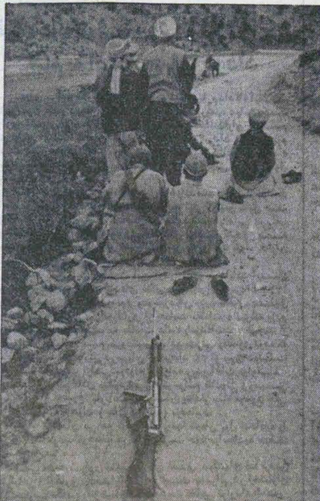
مبارزان خستگی ناپذیر افغانستان لحظه‌ای یاد خدا را فراموش نمیکنند آنها محراب جنگ را با محراب عبادت فرقی نمی‌نهند. هم‌جا و در همه حال بیاد خدا و براه او می‌جنگند

ایران با رمان صغویه قطب جاذبه نیروهای محرکه سیاسی و اقتصادی و فرهنگی کشورهای پهنه آسیا ما خاور - میانه بود. از هنگامیکه این جاذبیت را از دست میدهد این مجموعه ربه تجزیه می‌گردد. یکی از این اجزاء افغانستان است. بنابراین از نظر هویت فرهنگی، اجتماعی، مذهبی و وجه اشتراک‌های فراوانی میان دو کشور ایران و افغانستان موجود است.