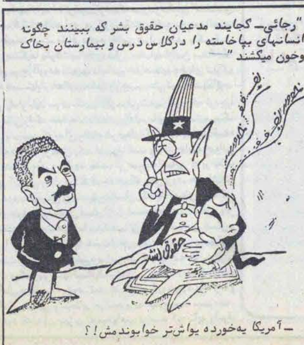
آمریکا به خورد می یوا شترت خوا بوندش!

ساعات شرعی باقی تهران: چهارشنبه ۲۷ آبان ۱۳۵۹ برابر ۱۹ ذیحجه ۱۴۰۰ اذان مغرب ۱۷/۲۱ پایان شفق ۱۸/۲۷ طول روز ۱۲ ساعت و ۴۰ طلع فجر (فردا) ۴/۵۲ طلع آفتاب (فردا) ۶/۲۲ ظهر شرعی (فردا) ۱۱/۴۹ اذان مغرب (فردا) ۱۷/۲۱