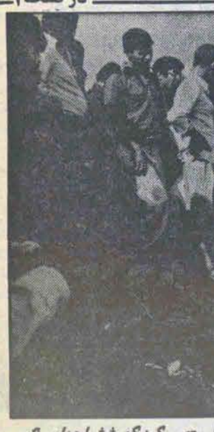
این تنها یک سند از اسناد بسیار جنایات رژیم صدام است. کودک ششماهه ای که در اثر حمله هوایی به دزفول شهید شده است در عکس دیده میشود.