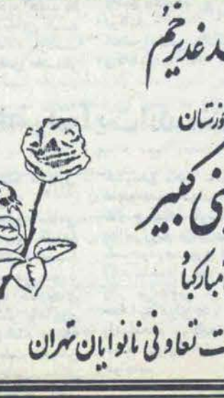
گرامی سالروز عید غدیر خم

تهران - خبرگزاری پارس - وزارت امور خارجه به نقل از سرکنسولگری جمهوری اسلامی ایران در هامبورگ گزارش داد گروه کثیری از دانشجویان ایرانی مقیم در هامبورگ ضمن ارسال نامه با مراجعه به این کنسولگری خواستار مراجعت به ایران و شرکت در جنگ علیه نیروهای متجاوز عراقی شده اند.