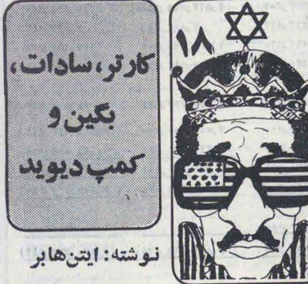
نوشته: ایتن هابر علی اکبر سمنار شاد

در همین زمان، سادات ووا بر زمین نیز با یکدیگر خلوت کرده و به مذاکره نشسته بودند. سادات قبلاً " وسیله الیزاز در جریان موقوف قرار گرفته بود. روبه وایزمن کرد و گفت: "به تداوم مذاکرات خوشبین نبوده و آنرا خاتمه یافته تلقی می‌کنم، با تقاضای شما، هرگز نمی‌توانم در جهان‌عرب حمایتی پیدا کرده و آنرا بفروشم، آخر کسی هم بفکر مسن باشد!" کارتز الیزاز و باراک، اصول اصلی پیشنهاد جدید را به رشته تحریر درآوردند. پس از انجام این کار، کارتز رو بهد باراک کرد و گفت: "حالا، از این به بعد، نام امید من به علاقه اسرائیل در پیدا نمودن راه‌حلی عادلانه و معقول جهت رسیدن به یک صلح پایدار بسادات، مایلم این امر را به سایرین نیز بگوئید." جلسه پایان یافت، ولی کارتز میخواست نتایج مورد نظر را در همان شب بدست آورد. از این روی به جست‌وجوی بکین پرداخت پس از آنکه او را یافت مصر " خواست در موضع خود نسبت به بادی‌های احداث شده در شبه جزیره سینا تجدید - نظر کند، ولی به نظر میرسد که دم گرم او در بکین بی تاثیر بود. بکین اظهار داشت: "آقای پرزیدنت، فراموش کنید. ادامه‌دهار