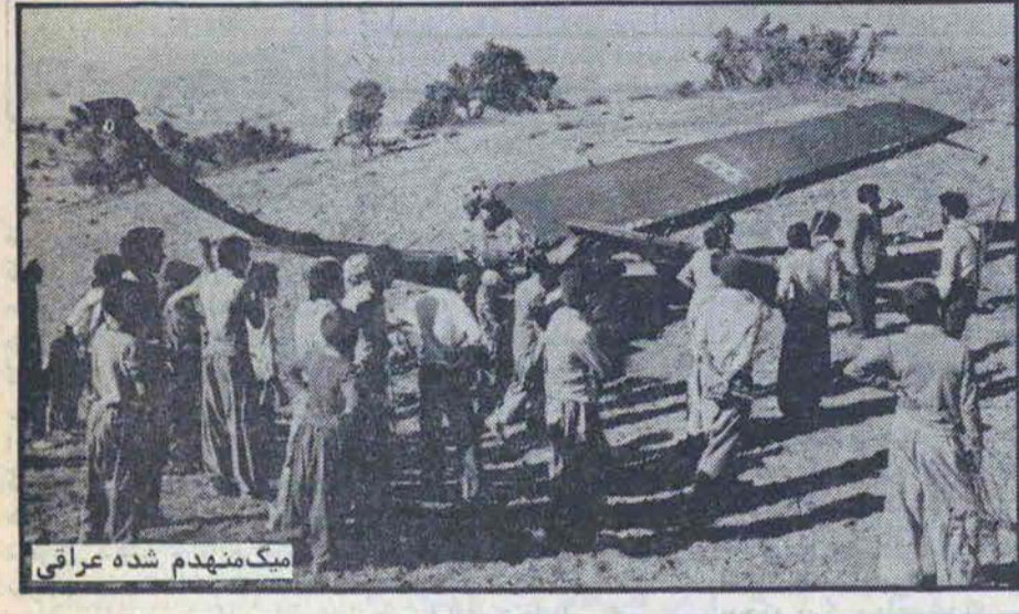
یک منهدم شده عراقی

صدها تانک عراقی در مرز خوزستان به محاصره رزمندگان جمهوری اسلامی ایران درآمد در صفحه ۱۵