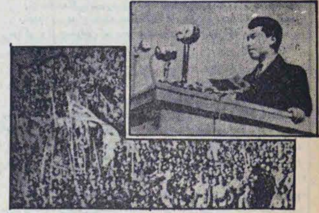
کیم ایل سونگ رهبر انقلاب کره پس از بازگشت پیروزمندان به میهن

امروز سی و دومین سالگرد تشکیل دولت جمهوری دمکراتیک خلق کره است. کره ۳۵ سال (۱۹۴۵ - ۱۹۱۵) مستعمره ژاپن بود. کیم ایل سونگ رئیس جمهور کنونی در سال ۱۹۴۶ اتحادیه ضد امپریالیسم و در سال ۱۹۴۷ ارتش انقلابی خلق کره را تشکیل داد و برای آزادی کشور علیه نیروهای ژاپنی به مبارزه پرداخت و سرانجام در سال ۱۹۴۵ کشور کره از یوغ امپریالیسم ژاپن رهائی یافت. اما امپریالیسم جهانخواه آمریکا بجای ژاپن قسمت جنوبی کره را به اشغال خود درآورد و حکومت نظامی خود یعنی دولت پوئالی کره جنوبی را تشکیل داد. مردم کره در یک جنگ عدلانه سه سال با ایستادگی در برابر حملات تجاوزکارانه امپریالیسم آمریکا در ۲۷ - ۱۹۵۳ شاهد پیروزی را در برگرفت. اما از آن تاریخ تاکنون هنوز اتحادیه کره برقرار نشده و جامعه مصیبت بار تفرقه بردوش مردم کره تحمل می شود.