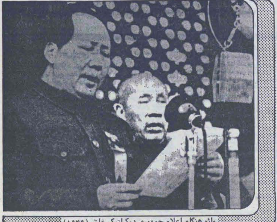
مائو هنگام اعلام جمهوری دموکراتیک خلق (۱۹۴۹)

حزب درهم کوبیده شده و جو تفاهم و وحدت در سراسر کشور بوجود آید. همزمان با طرح این تز، در زمینه اقتصادی نیز تز "جهش بزرگ به پیش" را مطرح ساخت. از دیگر خواسته‌های مائو تبدیل نظام متمرکز اداری به نظام شورائی بود، زیرا خود مائو ابتدا در "کیانگ سی" جمهوری شوراها را مستقر کرده بود. تزهای "صدگل" و "جهش بزرگ به پیش" در همان زمان با مخالفت عددهای