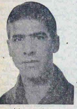
ستونیار دوم خلیان عباس مالیر

از نظر مسائل امنیتی ستاد هماهنگی مقبول افتاده و همه نیر وها (ی مسلح) پذیرفته اند و بان امید بسته اند