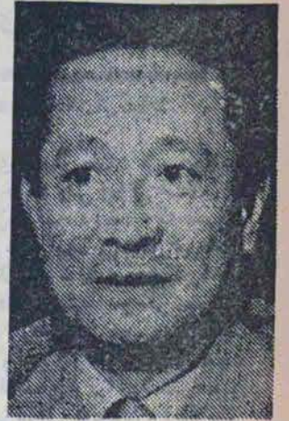
فان هین وزیر خارجه و اطلاعات ویتنام