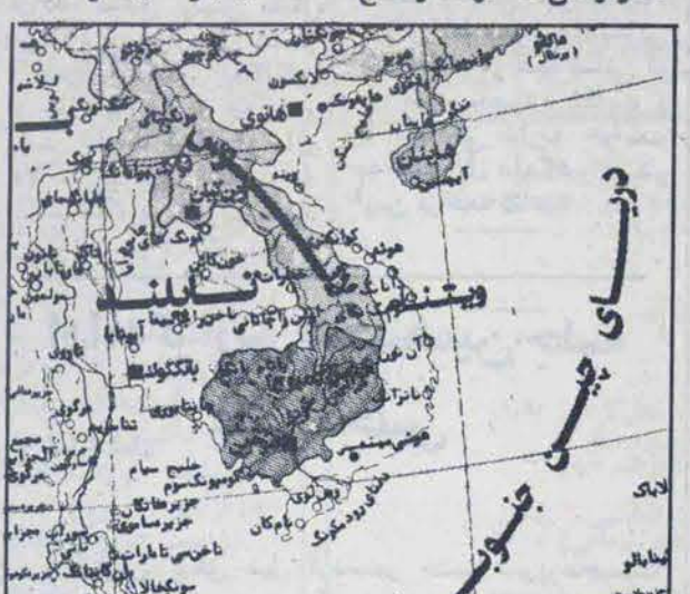
نقشه منطقه جنوب شرق آسیا

نابودی رژیم پهلوی این بود که نیروهای وی ۳ میلیون کامبوج را قتل عام کردند. پل پت و سایر بقایای رژیم او اکنون به تایلند فرو آورده اند.