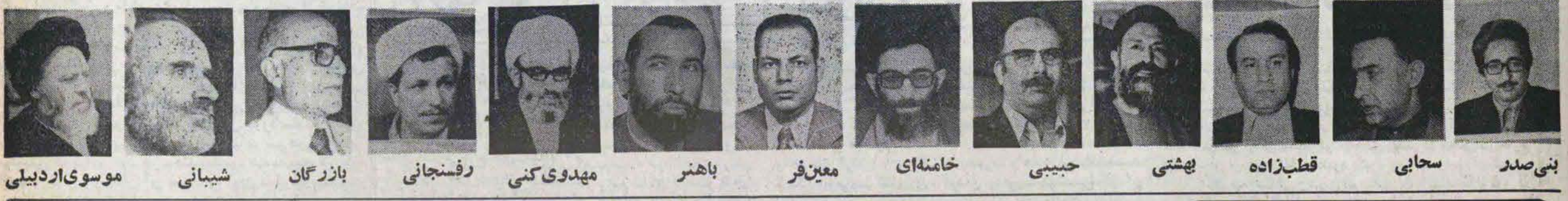
بنی صدر سحابی قطب‌زاده بهشتی حبیبی خامنه‌ای معین‌فر باهنر مهدوی کنی رفسنجانی بازرگان شیبانی موسوی اردبیلی

روزنامه انقلاب اسلامی صاحب‌القبض سید ابوالحسن بنی‌صدر مدیرمسئول: محمدجعفر سر دبیر: سید جمال‌الدین موسوی حاجان امام خمینی مقابل دارو دست چاپ و نشر ایران چاپ